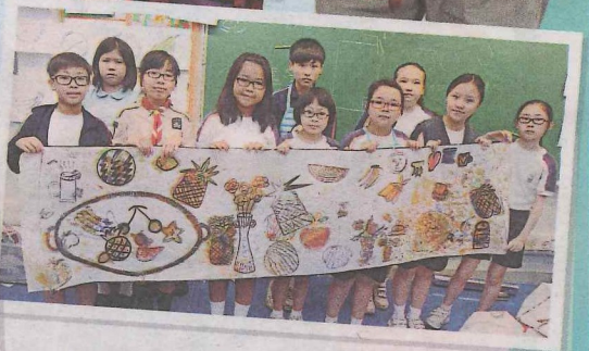
▲▲集結初小、高小的集體創作畫，以「後印象主義」的短筆觸作畫，一共四十名學生親手完成，每人都有各自負責完成的部分，名副其實集眾人之力完成！

如果你還以為藝術只流於平面創作，或者獨自躲在美術室沉默作畫的話，接下來的創作將會帶你跳出框框！東涌天主教學校（小學部）每年均邀請藝術工作者到校進行藝術工作坊，今年以「後印象主義」為主題，除了校內四周的大型平面立體展覽外，更有橫跨小一至小六的集體創作畫，這種新穎創作教學生又驚又喜！