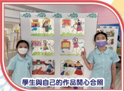
學生與自己的作品開心合照