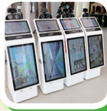
GFAI (Guardforce AI)

你好，我是禮賓機械人。我的頭部有一個溫度視像鏡頭，我會於校門口迎接各位同學及家長外，也會自動為各位量度體溫。有需要的嘉賓，也可以於我頭部的螢光幕掃描安心出行碼（QR code）。同學們經過的時候可以留意我身體上的螢光幕，看看有沒關於學校的新消息或新影片啊！