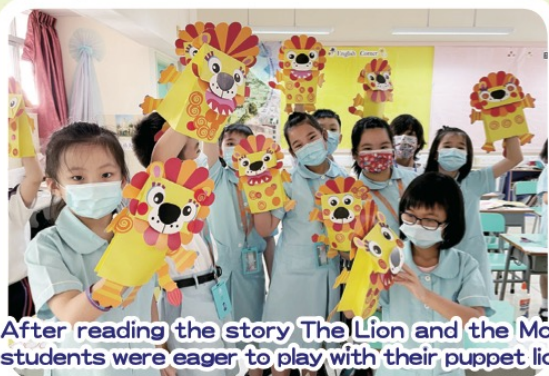
After reading the story The Lion and the Mouse, students were eager to play with their puppet lions.

子曰：「學而時習之，不亦說乎？有朋自遠方來，不亦樂乎？人不知而不愠，不亦君子乎？」 《論語》學而第一