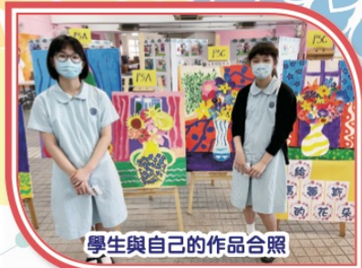
學生與自己的作品合照