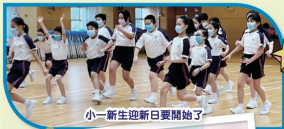
小一新生迎新日要開始了