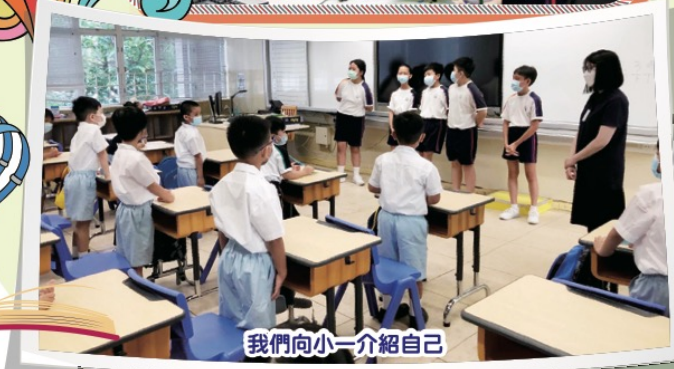
我們向小一介紹自己