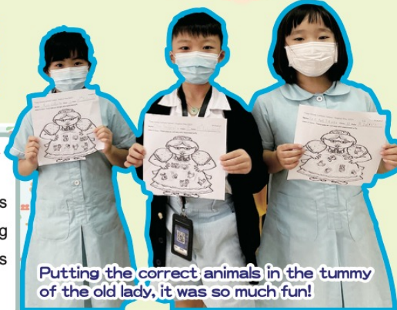
Putting the correct animals in the tummy of the old lady, it was so much fun!

Due to the pandemic, students experienced different activities in their classrooms. The activities included story-telling, craft-making related to the stories, doing reading tasks, watching videos about P.6's catwalk show, a short topic-based video and a drama performance.