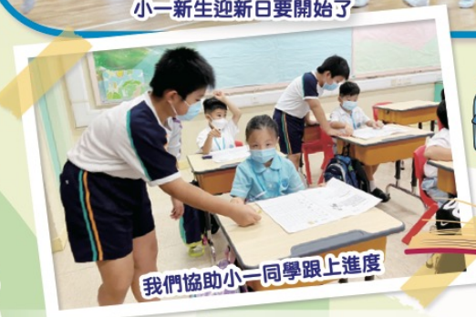
我們協助小一同學跟上進度