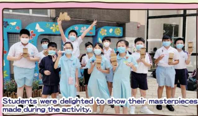
Students were delighted to show their masterpieces made during the activity.