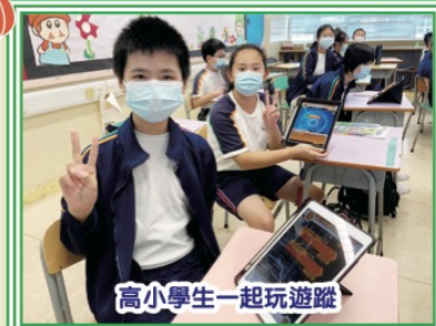
高小學生一起玩遊蹤