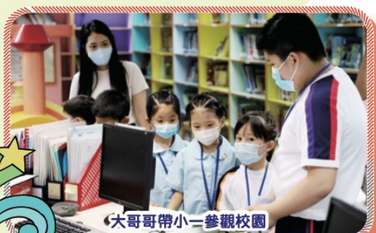
大哥哥帶小一參觀校園